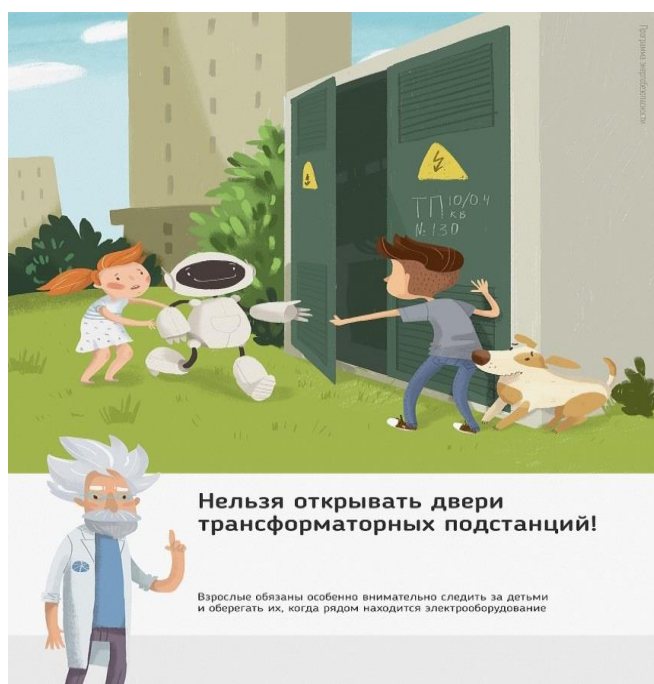
Рис.1 Нельзя открывать двери трансформаторных подстанций

Ежегодно энергетики проводят для школьников познавательные уроки, конкурсы рисунков и историй на тему электричества и правильного с ним обращения. Но работы одних энергетиков в данном направлении недостаточно, для полного понимания проблем электробезопасности нужен пример общества, в котором растет ребенок, и, конечно же, главным образом родителей. Эта работа приносит свои результаты: электротравмы на энергетических объектах единичные, и каждый случай становится поводом для служебной проверки. Но только технических мер мало для того, чтобы полностью обезопасить детей. Им нужен пример родителей.