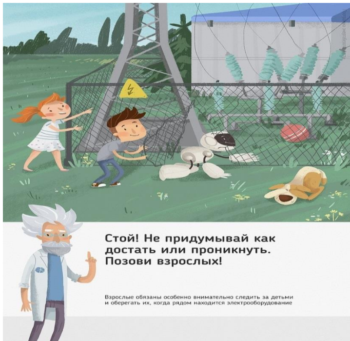
Рис. 5 Стой! Не придумывай как достать или проникнуть. Позови взрослых!